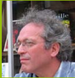
Artiste du réseau Solidaires Biennales2018.net

Rendez-vous les mercredis 5 septembre, 3 octobre, 7 novembre, 5 décembre 2018 et 9 janvier 2019 à 19h00 au Bar du marché, place des Cordeliers, à Auxerre.